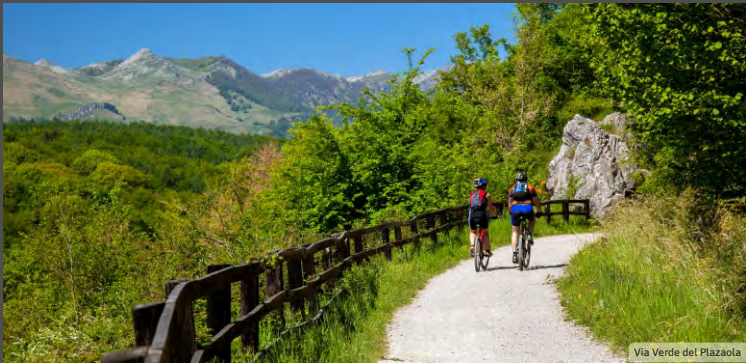
Via Verde del Plazaola