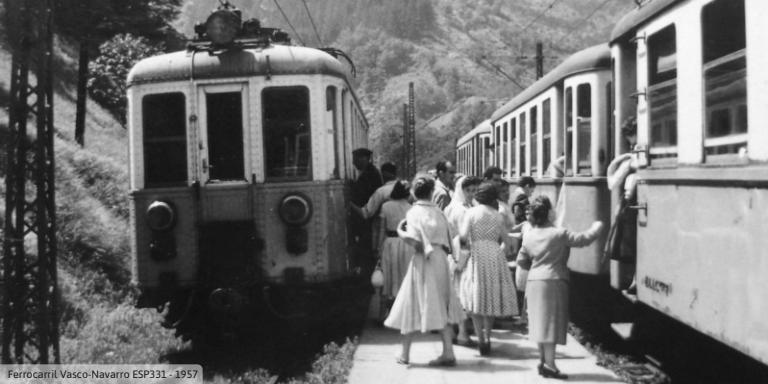
Ferrocarril Vasco-Navarro ESP331 - 1957